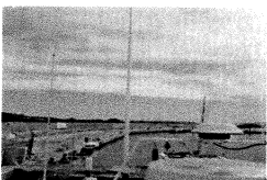
IMG-20190923-WA0008.jpg 112 KB