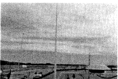
IMG-20190923-WA0010.jpg 85 KB