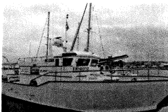
IMG-20190923-WA0007.jpg 133 KB