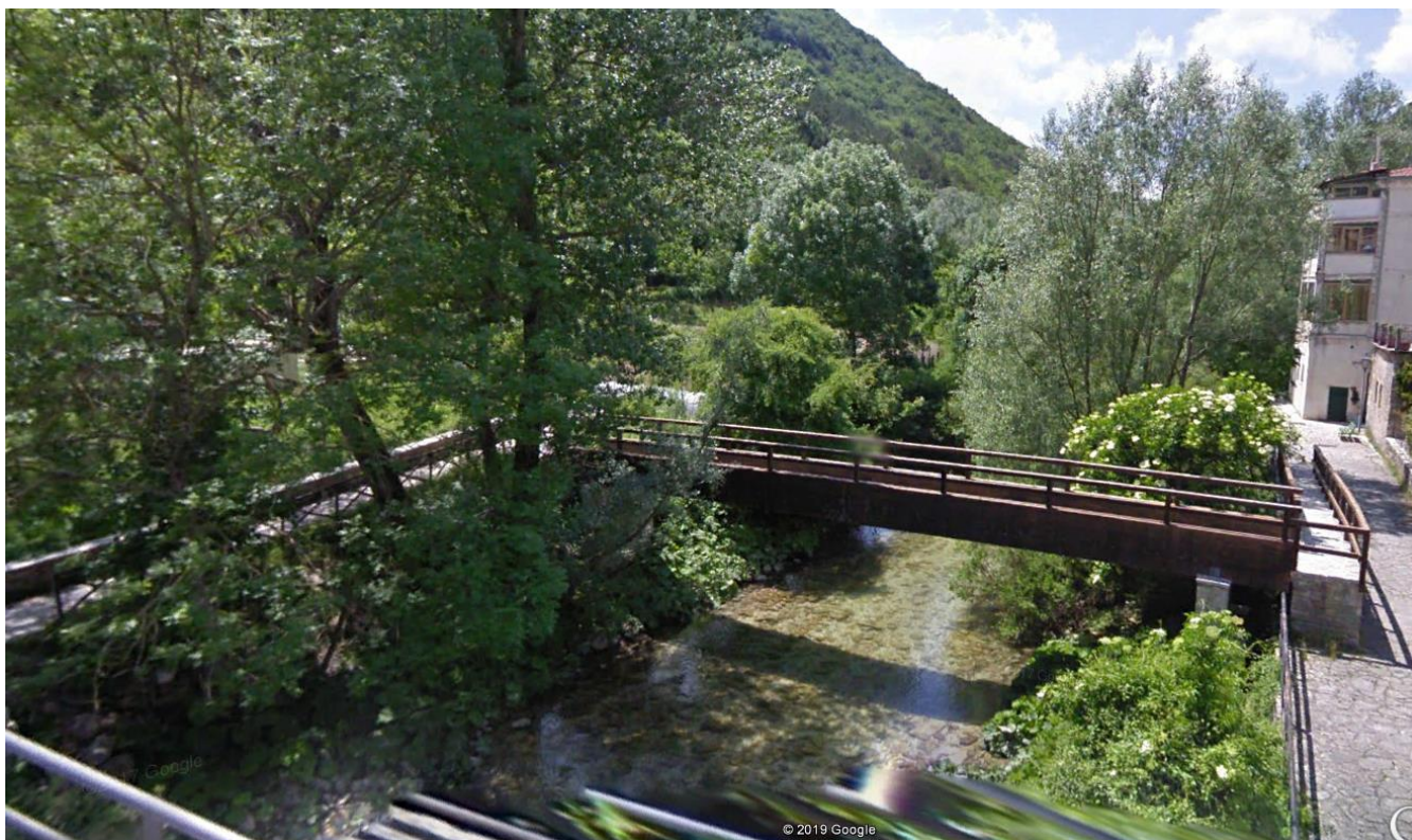
Fig. 2. Tratto non confinato del corpo idrico CI_Sangro_2 a Villetta Barrea (Sangro 2_ 8) con una morfologia del tipo "Rettilineo" (Immagine tratta da Google Earth)