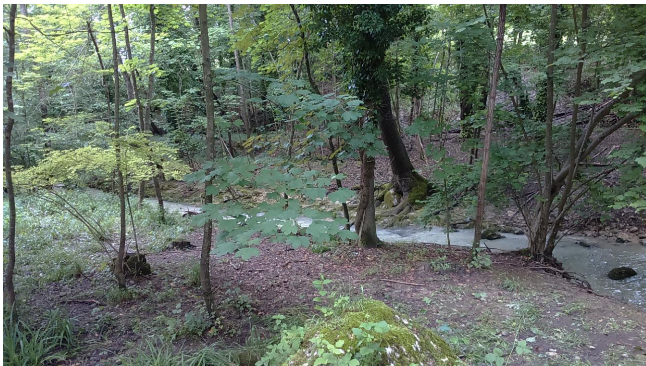
Fig. 1. Corpo idrico CI_Alento_1 (tratto Alento_1_3) nelle vicinanze del depuratore di Serramonacesca