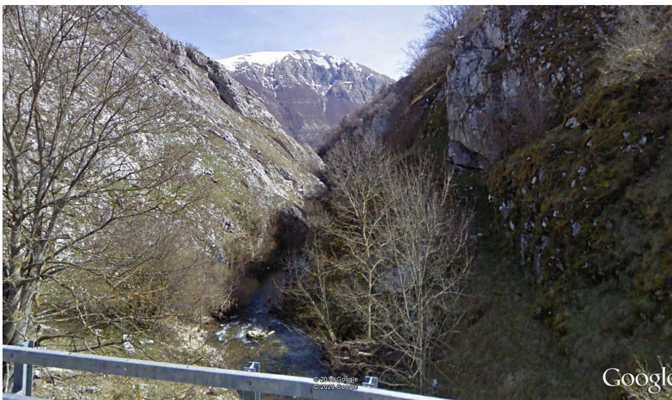
Fig. 3. Tratto confinato del corpo idrico CI_Sangro_2 a Opi (Sangro 2_ 4) con una morfologia del tipo "Canale singolo"