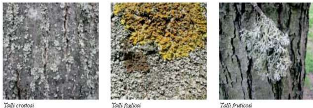
Fig. 1 – Tipologie di corpi vegetativi (talli) nei licheni

Si possono inoltre riconoscere due differenti tipologie di talli lichenici: