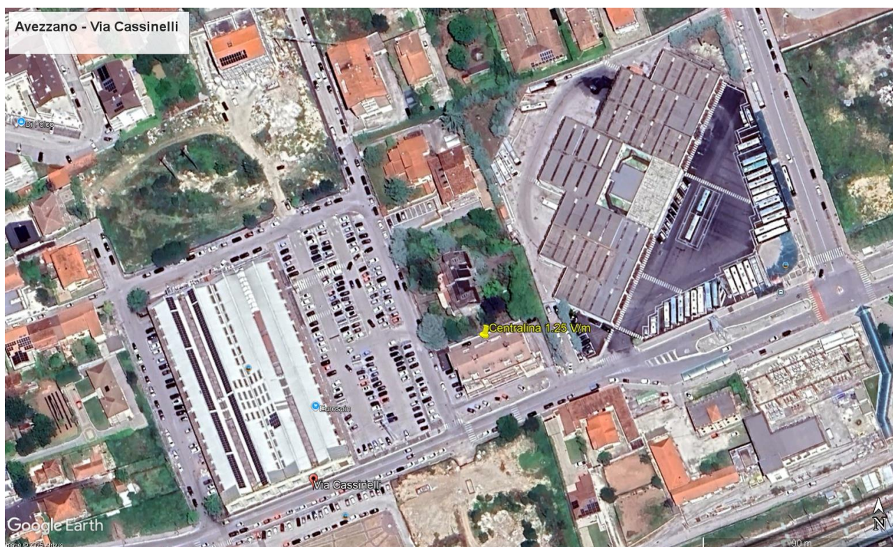
Panoramica del Sito: Avezzano - Via Cassinelli.